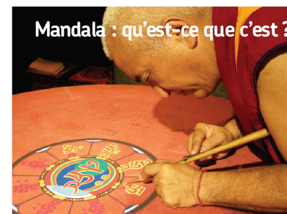
Mandala : qu'est-ce que c'est ?

Représentation circulaire organisée autour d'un centre. Le mandala est une invitation au voyage... Mode d'expression symbolique pratiqué depuis la nuit des temps par de nombreux peuples dans le monde, il constitue un art sacré, un rituel qui relie l'homme à l'universalité.