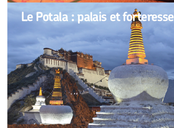
Le Potala : palais et forteresse

Représentation circulaire organisée autour d'un centre. Le mandala est une invitation au voyage... Mode d'expression symbolique pratiqué depuis la nuit des temps par de nombreux peuples dans le monde, il constitue un art sacré, un rituel qui relie l'homme à l'universalité.